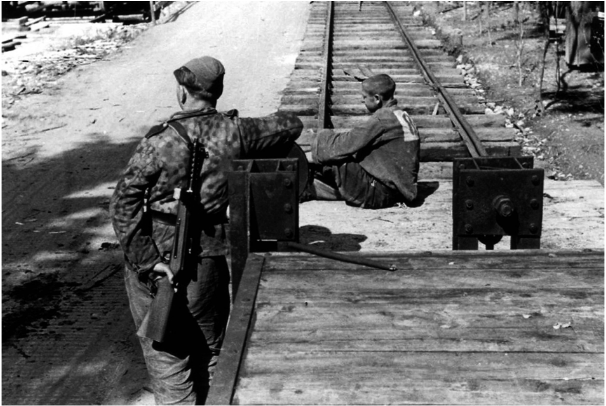
Ein Kriegsgefangener unter Bewachung eines SS-Soldaten, der eine Steyr Maschinenpistole 34(ö), hergestellt von der Steyr-Daimler-Puch AG, trägt. Die SS-Tarnjacke mit Erbsenmuster war als Bekleidung für Wachmannschaften eher untypisch.

Nach Zeitzeugenerinnerungen wurden die im Werk arbeitenden Franzosen gut behandelt und durften auch Pakete aus ihrer Heimat erhalten. 283 Sie durften sich in der Ortschaft St. Valentin sogar einigermaßen frei bewegen, während die im Gemeinschaftslager Herzograd untergebrachten "Ostarbeiter" und "Ostarbeiterinnen" schon deutlich strengeren Bestimmungen unterlagen. Von allen Ausländern wurden Russen am schlechtesten behandelt, denn die Nationalsozialisten sahen sie als "Untermenschen". 284